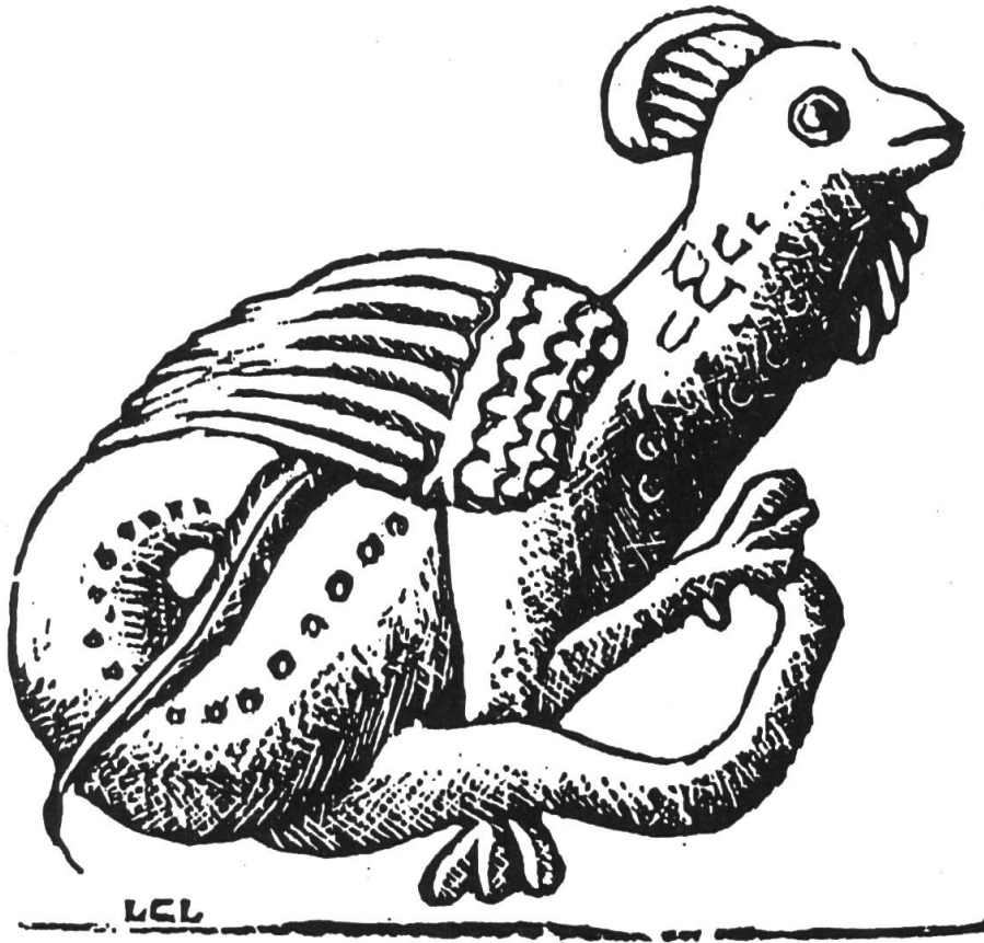
Fig. 3. Scultura della chiesa abbaziale di Vézelay. (Silografia di L. Charbonneau-Lassay.)

nota nel XII sec. a San Bernardo 18 , secondo cui «se è lui il primo a vedere gli altri, questi muoiono subito, se invece sono gli altri a vedere lui, è lui che muore». In altri luoghi il suo sguardo fa perdere la favella (Viganello, Balerna). Oppure incanta, anche da lontano (Carasso), o paralizza la preda (Isona) 19 . I galli basilischi, si diceva nel bacino della Tresa, se li si guarda negli occhi, «lanciano la fisica», espressione che può significare ‘fanno una magia, un incantesimo’ 20 (e che ci riporta ai tempi in cui le scienze naturali, la «fisica», e la magia erano tutt’uno), ma che il mio informatore interpreta come ‘ipnotizzare’ 21 .