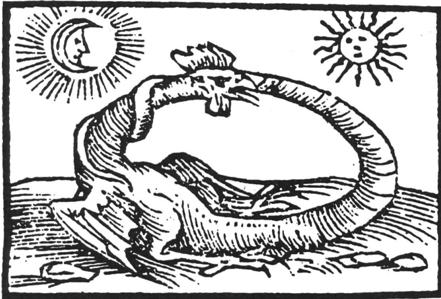
Fig. 1. Da Horapollo, Selecta hieroglyphica , 1597.

Nel medioevo il basilisco subisce anche una metamorfosi somatica e assume l'aspetto di «un gallo quadrupede e coronato, [...] con grandi ali spinose e una coda di serpente [...]». Il mutamento dell'immagine si riflette in un mutamento del nome; Chaucer, nel secolo XIV, parla di basilicock 4 . Si direbbe che la corona, interpretata come una cresta, abbia trasformato l'intero animale in un gallinaceo 5 (con residui ofidici ed eventualmente ali membranose, il che è normale data la sua natura satanica).