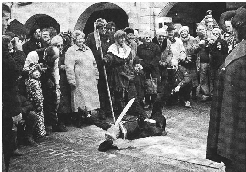
Das Tellenspiel vom Samstagmorgen ist zu Ende. «Gessler» streckt die Zunge heraus, während der Narr das Geschehen im Lied kommentiert.

Die neue Berner Fasnacht wird am Donnerstag nach der Herrenfasnacht mit der Ychüblete eröffnet. Dabei finden sich möglichst alle Guggenmusiken und viele Schaulustige, die der Abendver-