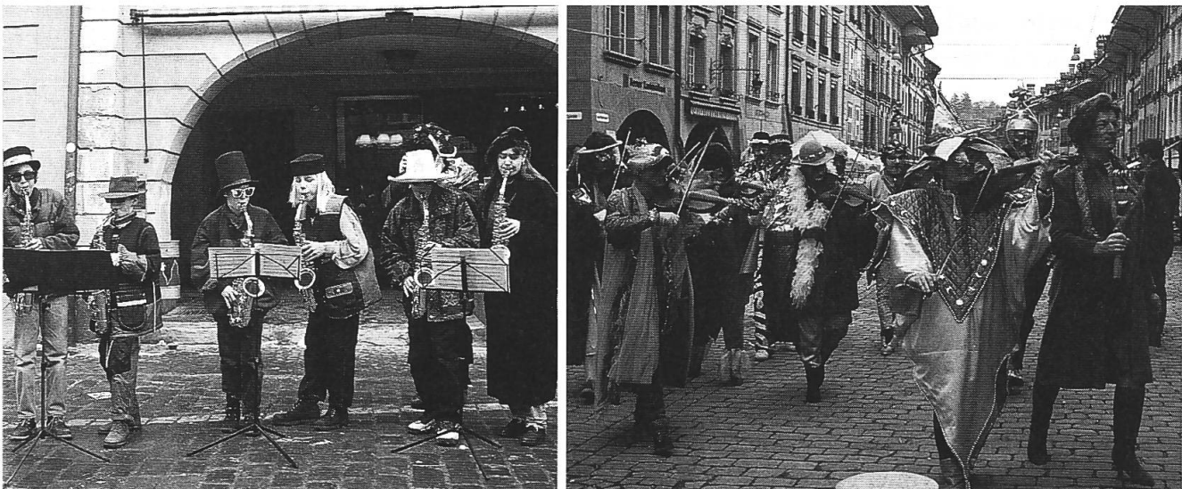
Schülerinnen und Schüler der Allgemeinen Musikschule Bern geben am Samstagmorgen ein Ständchen. – «Güegugge», eine hauptsächlich mit Violinen besetzte Guggenmusik in der Berner Altstadt.

Der Samstagmorgen vor dem Morgenstreich ist in der Berner Innenstadt stiller als üblich. Hunderte von aktiven und passiven Fasnächtlern verschlafen den zum wöchentlich wiederkehrenden Volksbrauch gewordenen Marktgang, um für den Fasnachtsumzug am frühen Nachmittag, das anschliessende Guggenmusik-Monsterkonzert auf dem Bundesplatz und den letzten Abend der Gassenfasnacht wieder fit zu sein. Andere Bernerinnen und Berner und einige auswärtige Connaisseurs flanieren in der Chramere (Kramgasse) herum, denn auf Bühnen vor den Brunnen tut sich allerlei von der feinen Art. Seit Jahren wartet ein Sextett, dessen Bläser mit Goldsternen übersäte Mäntel tragen, mit heitern Klassikern auf, während vor dem Konservatorium Jugendgruppen spielen, wie sie es in der Musikstunde gelernt und im Ensemble erprobt haben. Neben dem Ständchen einer Güegugge , einer ausschliesslich mit Streichinstrumenten besetzten Fasnachtsmusik, überra-