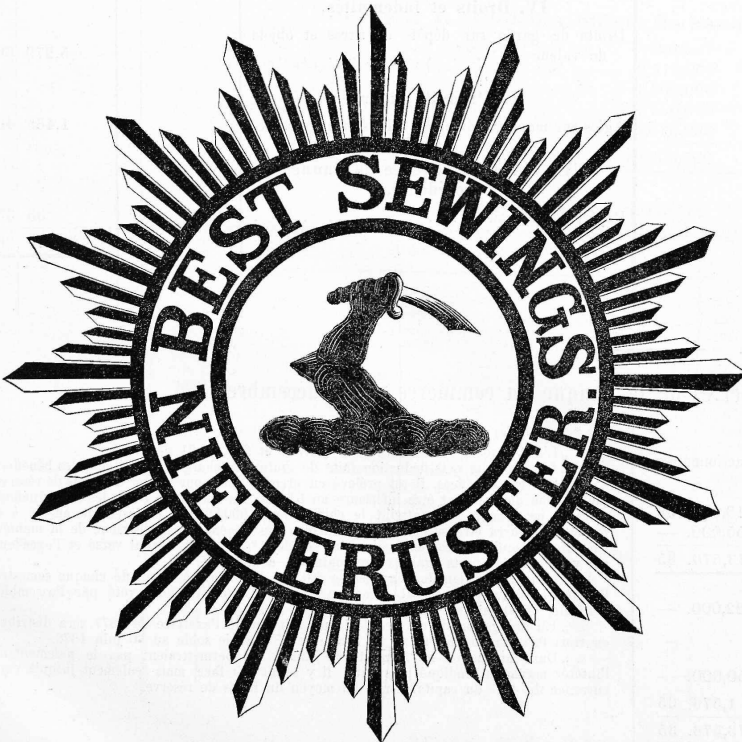
Nähfaden in Strangen.

Baumwoll-Spinnerei- und Zwirnerei Niederuster, Zürich.