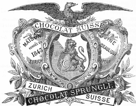
Chocolade- und Cacaopräparate.

David Sprüngli & Sohn, Fabrikanten, Zürich.