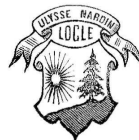
Chronomètres de marine et de poche.