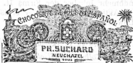
Chocolats et cacao.

Russ-Suchard & C ie , fabricants, Neuchâtel.