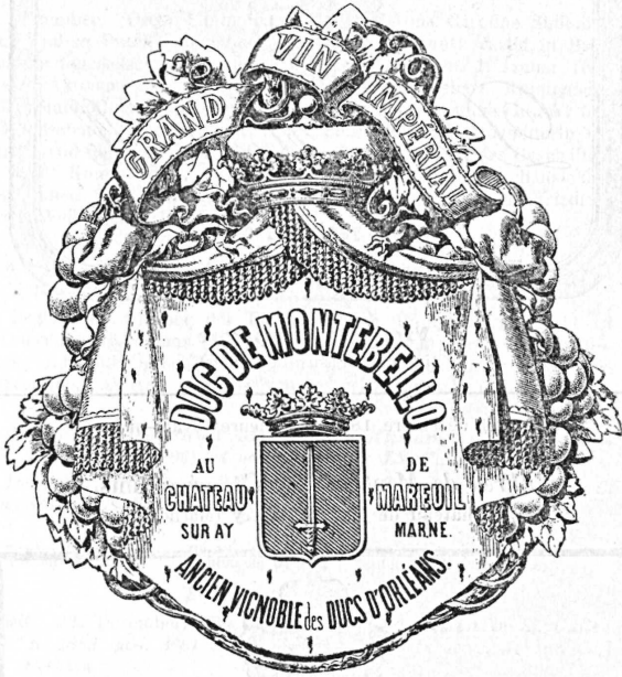
Vin de Champagne (à apposer sur bouteilles).