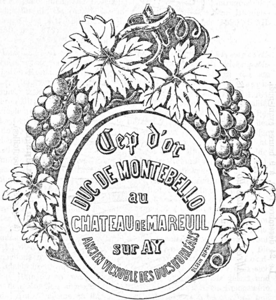
Vin de Champagne (à apposer sur bouteilles).