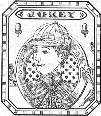
Cigarren deutscher Façon.

Eichenberger & C ie , Fabrikanten, Menziken (Schweiz).