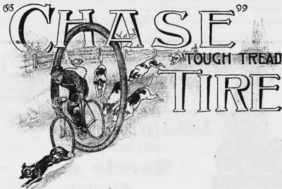
Pneumatische und massive Gummi-Reife.

Nr. 9506. — 7. September 1897, 4 Uhr p. L.-C. Chase & Co, Fabrikanten, Boston (Massachusetts, Nordamerika).