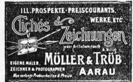
Genève 1896: Médaille d'argent.

Italie Agence d'affaires Contentieux commercial G. Saxer (307) 19, Rue Alfieri, Turin Références de premier ordre