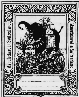
Bedruckte und gefärbte Baumwolltücher.

Friedrich Oertly, Fabrikant, Näfels (Schweiz).