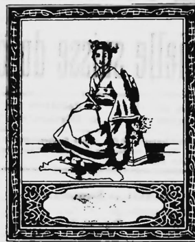
Bedruckte und gefärbte Baumwolltücher.

Friedrich Oertly, Fabrikant, Näfels (Schweiz).