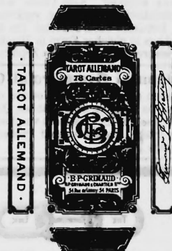
Cartes à jouer.

Nr. 10,563. — 16 novembre 1898, 8 h. a. Grimaud & Chartier , fabricants, Paris (France).