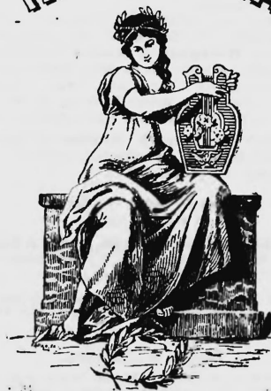
Pièces à musique.