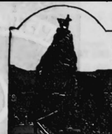
Hirschesprung of Deer Leap.

Zu medizinischem und pharmazeutischem Gebrauch präparierte chemische Substanzen.