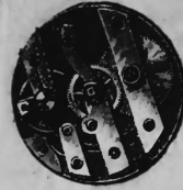
N o 11.

N o 8698. 16 mai 1902, 8 h. p. — Ouvert. — 2 modèles. — Calibres de montre. — Fabrique d'Ebauches de Sonceboz , Sonceboz (Suisse).