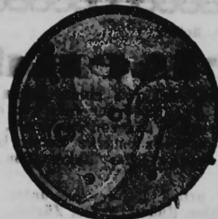
N o 202.

N o 8735. 30 mai 1902, 4 1/2 h. p. — Ouvert. — 1 modèle. — Mouvement de montre. — D. Perret fils , Neuchâtel (Suisse).