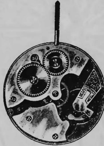
N o 23.