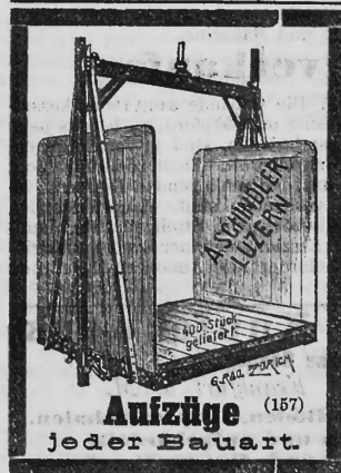
Aufzüge (157) jeder Bauart.