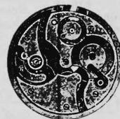
N o 1.