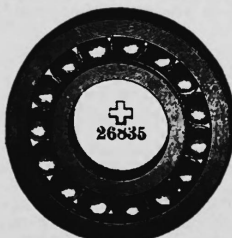
Patentiert in allen Kulturstaaten