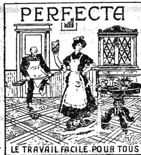
LE TRAVAIL FACILE POUR TOUS

Savons, lessives, tous produits pour lavage, blanchissage et nettoyage; parfumerie, bougies, tous articles pour l'éclairage, cires brutes et travaillées, cirages, encaustiques, épicerie, huiles et graisses, produits alimentaires.