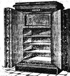
Illustrierte Kataloge gratis.

Es sind verschiedene Geldschränke gelegentlich auszuverkaufen. (1553 X) (728 I)