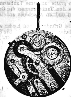
N o 1.