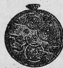
N o 1.