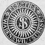
Abbildung der abgeänderten Marke:

Nr. 13641. — „Elektra“ Fabrik thermoelektrischer Apparate („Electra“ fabrique d'appareils thermoélectriques) („Electra“ fabbrica d'apparechi termoelettrici) („Electra“ thermoelectric appliances), in Wädenswil. — Die Markeninhaberin hat ihre in der Marke angegebene Zweigniederlassung in Lindau i. B. aufgegeben und demgemäß die bezügliche Angabe in der Marke unterdrückt. — Dem Amte mitgeteilt und eingetragen am 10. Februar 1915.