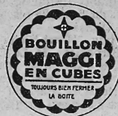
(Marque en trois couleurs: jaune, rouge et noir; inscriptions en rouge et noir sur fond jaune.)

drogues et articles de réclame concernant les marchandises susmentionnées et, en général, tous les produits et marchandises dont le commerce est permis.