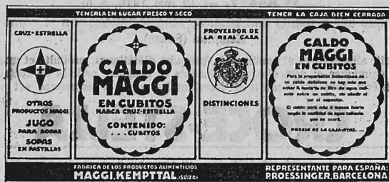
(Marque en trois couleurs: jaune, rouge et noir.)

Produits alimentaires et condiments, produits diététiques, produits et marchandises chimiques et agricoles, médicaments et drogues, articles de réclame et, en général, tous les produits et marchandises dont le commerce est permis.