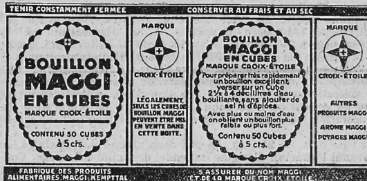
(Marque en trois couleurs: jaune, rouge et noir; inscriptions et dessins en rouge et noir sur fond jaune, à l'exception des inscriptions en jaune sur le fond noir des bordures d'en haut et d'en bas et des inscriptions en jaune sur le fond rouge des deux cases étroites.)

Produits alimentaires et condiments, produits diététiques, produits et marchandises chimiques et agricoles, produits pharmaceutiques (médicaments), drogues et articles de réclame concernant les marchandises susmentionnées et, en général, tous les produits et marchandises dont le commerce est permis.