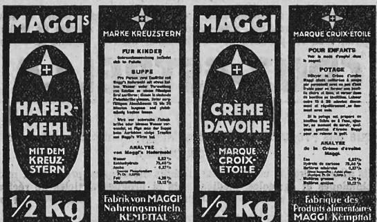
(Marque imprimée en rouge et blanc sur fond jaune.)

Produits alimentaires et condiments, produits diététiques, produits et marchandises chimiques et agricoles, médicaments et drogues, articles de réclame et, en général, tous les produits et marchandises dont le commerce est permis.