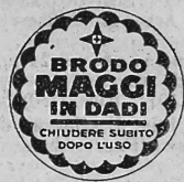
(Marque en trois couleurs: jaune, rouge et noir; inscriptions en rouge et noir sur fond jaune.)

Produits alimentaires et condiments, produits diététiques, produits et marchandises chimiques et agricoles, produits pharmaceutiques (médicaments), drogues et articles de réclame concernant les marchandises susmentionnées et, en général, tous les produits et marchandises dont le commerce est permis.