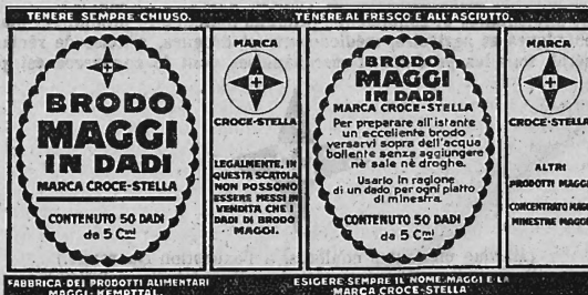
(Marque en trois couleurs: jaune, rouge et noir; inscriptions et dessins en rouge et noir sur fond jaune, à l'exception des inscriptions en jaune sur le fond noir des bordures d'en haut et d'en bas et des inscriptions en jaune sur le fond rouge des deux cases étroites.)

Produits alimentaires et condiments, produits diététiques, produits et marchandises chimiques et agricoles, produits pharmaceutiques (médicaments), drogues et articles de réclame concernant les marchandises susmentionnées et, en général, tous les produits et marchandises dont le commerce est permis.