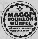
(Marke in drei Farben: gelb, rot und schwarz; Text in rot und schwarz auf gelbem Grund.)

Nahrungs- und Genussmittel, Nährpräparate, chemische und landwirtschaftliche Erzeugnisse und Waren, Arzneimittel, Drogen und auf die vorgenannten Waren bezügliche Reklameartikel, sowie überhaupt alle im freien Verkehr gestatteten Erzeugnisse und Waren.