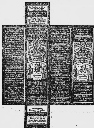
(Druck: rot, blau und weiss).

Nr. 39508. — 12. Februar 1917, 8 Uhr. E. Mettler-Müller, Fabrikation und Handel, Rorschach (Schweiz).