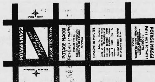
(Marque imprimée en rouge et noir sur fond jaune).

Produits alimentaires et condiments, produits et marchandises diététiques, pharmaceutiques et agricoles de tout genre.