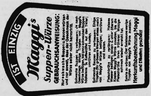
(Marke in drei Farben: rot und schwarz auf gelbem Grund).

Nahrungs- und Genussmittel, diätetische, pharmazeutische, chemische und landwirtschaftliche Erzeugnisse und Waren aller Art.