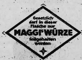
(Marke in zwei Farben: rot auf gelbem Grund).

Nahrungs- und Genussmittel, diätetische, pharmazeutische, chemische und landwirtschaftliche Erzeugnisse und Waren aller Art.