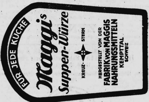
(Marke in drei Farben: rot und schwarz auf gelbem Grund).

Nahrungs- und Genussmittel, diätetische, pharmazeutische, chemische und landwirtschaftliche Erzeugnisse und Waren aller Art.