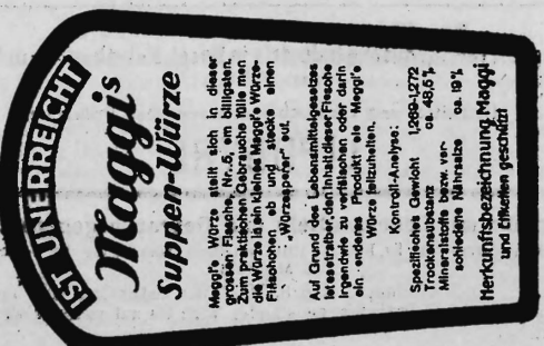
(Marke in drei Farben: rot und schwarz auf gelbem Grund).

Nahrungs- und Genussmittel, diätetische, pharmazeutische, chemische und landwirtschaftliche Erzeugnisse und Waren aller Art.