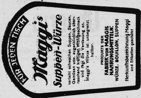
(Marke in drei Farben: rot und schwarz auf gelbem Grund).

Nahrungs- und Genussmittel, diätetische, pharmazeutische, chemische und landwirtschaftliche Erzeugnisse und Waren aller Art.