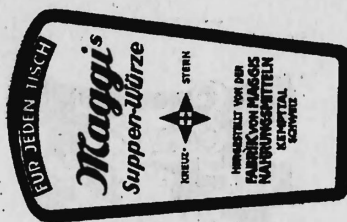
(Marke in drei Farben: rot und schwarz auf gelbem Grund).

Nahrungs- und Genussmittel, diätetische, pharmazeutische, chemische und landwirtschaftliche Erzeugnisse und Waren aller Art.