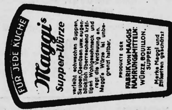
(Marke in drei Farben: rot und schwarz auf gelbem Grund).

Nahrungs- und Genussmittel, diätetische, pharmazeutische, chemische und landwirtschaftliche Erzeugnisse und Waren aller Art.