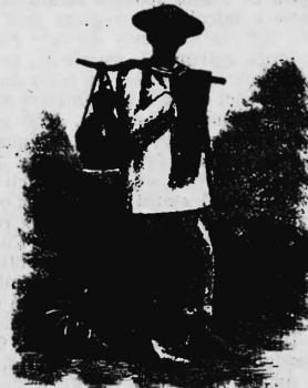
(Uebertragung der Nr. 30466 von der frühern Firma Kuenzle & Streiff Aktiengesellschaft, Zürich).

Garne und Fäden, Gespinste, Gewebe, Wirk- und Filzwaren, Spitzen und Posamentierartikel, Hüte und Schirme, Putzmacherartikel, Kautschuk-, Guttapercha-, Zelluloid- und Asbestfabrikate, Wachstuch, Linoleum, Teppiche, Leder, Schuhe, Papiere und Papierfabrikate, Seilerwaren, Zement, Farbwaren, Oele, Chemikalien, Tinte, Wächse und Lederappreturen, Metalle, roh und verarbeitet, Kurzwaren, Spielsachen, Galanteriewaren, musikalische Instrumente, Maschinen, Holzwaren, Bürstenbinder- und Korbwaren, Töpferwaren, Glas und Glaswaren, Lampen, Laternen, Getränke und Esswaren.