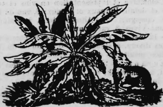
(Uebertragung der Nr. 30463 von der frühern Firma Kuenzle & Streiff Aktiengesellschaft, Zürich).

Garne und Fäden, Gespinste, Gewebe, Wirk- und Filzwaren, Spitzen und Posamentierartikel, Hüte und Schirme, Putzmacherartikel, Kautschuk-, Guttapercha-, Zelluloid- und Asbestfabrikate, Wachstuch, Linoleum, Teppiche, Leder, Lederwaren, Schuhe, Papiere und Papierfabrikate, Seilerwaren, Zement, Farbwaren, Oele, Chemikalien, Tinte, Wächse und Lederappreturen, Metalle, roh und verarbeitet, Kurzwaren, Spielsachen, Galanteriewaren, musikalische Instrumente, Maschinen, Holzwaren, Bürstenbinder- und Korbwaren, Töpferwaren, Glas und Glaswaren, Getränke und Esswaren.