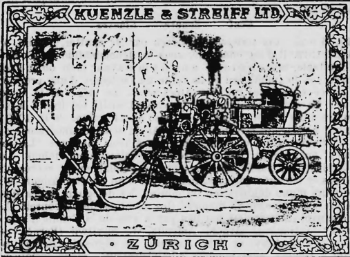
(Uebertragung der Nr. 30460 von der frühern Firma Kuenzle & Streiff Aktiengesellschaft, Zürich).

Manufaktur-, Quincaillerie- und Eisenwaren.