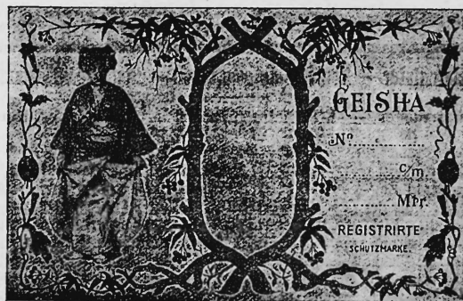
(Uebersetzung der Nr. 16200 von der früheren Firma gleichen Namens)

Gefärbtes und merzerisiertes baumwollenes Nansocgewebe.