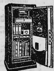
Komplette Stahlkammer Kassenschränke 1000 Einmuerkassen

Ecrire sous chiffre H 6115 X à Publicitas, Genève.