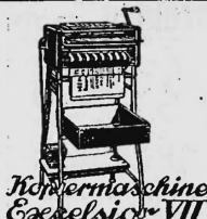
Nähmaschine Excelsior VII

Diese Maschine ist ein Automat in höchster Vollendung. Alle Arbeitsvorgänge beruhen auf dem ineinandergreifen gefräster Stahlzahnräder. Bei halbwegs ordnungsmässiger Bedienung sind Störungen ausgeschlossen. Die Maschine leistet in Güte der Kopien, Einfachheit der Bedienung und Sparsamkeit des Papierverbrauches mehr als jede andere. Lange Jahre eifriger Versuche und die Erfahrungen eines Menschenalters im Bau von Kopiermaschinen haben hier eine Ausführung geschaffen, die den höchsten Anforderungen genügt u. dem durch die Sorgfalt ihrer Arbeitsleistungen bekannten Namen der Firma Socnneken Ehre macht. '2582