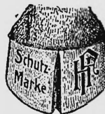
(Uebertragung mit abgeänderter Warenangabe der Nr. 17455 von Hans Fischer, Luzern).