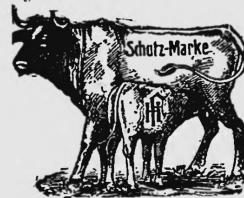
(Uebertragung der Nr. 17454 von Hans Fischer, Luzern).