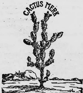
TJAP POEHOEN LIDA BADAK

Alle Arten baumwollene, wollene, halbwoollene, leinene, halbleinene, seidene, halbseidene und andere Manufakturen, Eisenwaren, Papier, Gummiwaren, alkoholfreie Getränke, Kleidungsstücke, Garne, Fleisch-, Fisch-, Gemüse- und Fruchtconserven, Chemikalien, pharmazeutische Produkte, Lampen und Lampenteile, Emaillewaren, Lederwaren, Lederappretur, Korallen und Perlen, Webwaren.