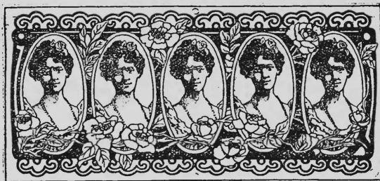
(Uebertragung der Nr. 20710 von Chemische Fabrik Griesheim-Elektron, Frankfurt am Main).

Künstliche, organische Farbstoffe und andere chemische Produkte, insbesondere Zwischenprodukte für Farbenerzeugung, Färberei, Zeugdruckerei und Lackfabrikation, sowie Heilmittel.