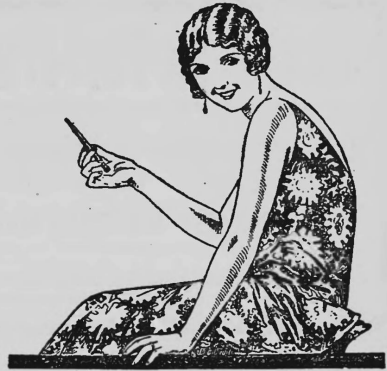
Achten Sie auf den eingravierten Namen.