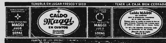
(Marque imprimée en rouge sur fond jaune).

Bouillons et consommés sous toutes formes, par exemple sous forme liquide, solide, pâteuse.