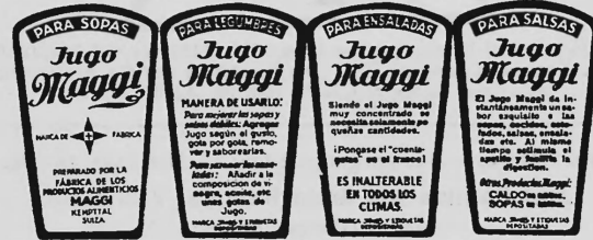
(Marque imprimée en rouge sur fond jaune).

Aromes et condiments sous toutes formes, par exemple sous forme liquide, solide, pâteuse.