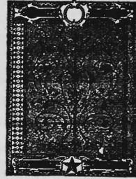
(La marque est exécutée partiellement en rouge).

Papier, à savoir papiers de soie de toutes sortes, papier de toilette, papier à lettres, papier pour machines à écrire, couvertures, et papier d'échantillons.