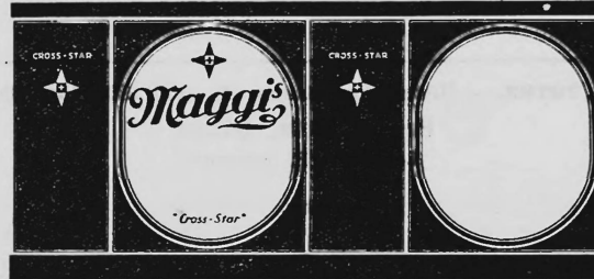
(Farbgebung: gelb und rot).

Nahrungs- und Genussmittel, diätetische, pharmazeutische, chemische und landwirtschaftliche Erzeugnisse.