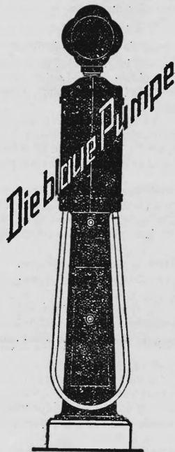
(Das Bild der Pumpe wird blau ausgeführt)

Nr. 74979. — Hinterlegungsdatum: 5. Mai 1931, 18 Uhr «BP», Benzin- und Petroleum A.-G. («BP», Benzine et Pétroles S. A.), («BP», Benzina e Petroli S. A.), Handel, Uraniastrasse 35, Zürich (Schweiz) Benzine, Petrole und Mineralöle.