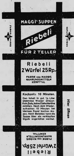
Farbenanspruch: gelb und rot.

Nr. 76711. — Hinterlegungsdatum: 21. Dezember 1931, 16 Uhr. Fabrik von Maggis Nahrungsmitteln, Fabrikation und Handel, Kempttal (Schweiz).