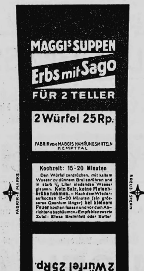
Farbenanspruch: gelb und rot.

Nr. 76712. — Hinterlegungsdatum: 21. Dezember 1931, 16 Uhr. Fabrik von Maggis Nahrungsmitteln, Fabrikation und Handel, Kempttal (Schweiz).