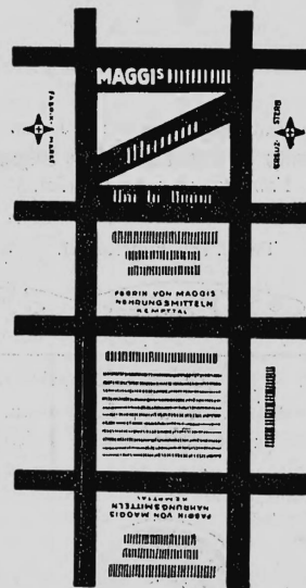
Farbenanspruch: gelb und rot.

Nahrungs- und Genussmittel, diätetische, pharmazeutische, chemische und landwirtschaftliche Erzeugnisse.