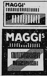
Farbengebung: gelb, rot und grün.

Nahrungs- und Genussmittel, diätetische, pharmazeutische, chemische und landwirtschaftliche Erzeugnisse.