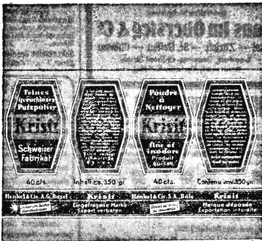
(Die Marke wird in orange, dunkelblauer, blaugrauer und weisser Farbe ausgeführt.)

Reinigungsmittel, Seifen aller Art (auch parfümierte), Seifenpulver, Soda, Bleichsoda, Stärke und alle andern Waschmittel.