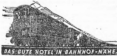
DAS GUTE HOTEL IN BAHNHOF-NAHE