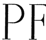
Abbildung der Stempelzeichen, die von den Fabrikanten von Edelmetallwaren zur Stempelung von Schmelzprodukten verwendet werden — Reproduction des poinçons servant à marquer les produits de la fonte par les fabricants d'ouvrages en métaux précieux — Riproduzione dei marchi che servono a marcare i prodotti della fusione dai fabbricanti di oggetti di metallo prezioso.

Pauli Frères, fabrique de boîtes de montres