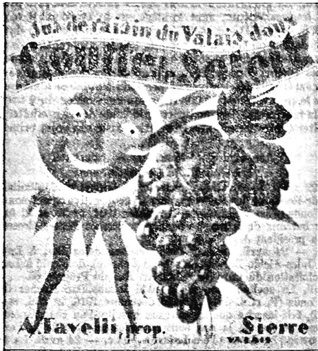
(La marque est exécutée en jaune, vert, bleu, rouge et blanc.)

Jus de raisin du Valais, doux, non fermenté.