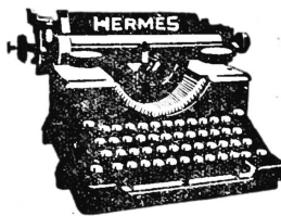
Dass an der