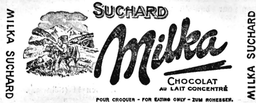
(Inscriptions et dessin en or et noir sur fond mauve.)

Chocolat au lait, cacao; produits préparés avec du chocolat au lait, savoir: articles de confiserie et de pâtisserie et autres produits et boissons alimen- taires sous toutes les formes.