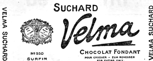
(Inscriptions et dessin en or sur fond rouge-grenat.)

Chocolat, cacao, produits préparés avec du chocolat, savoir: articles de confiserie et de pâtisserie et autres produits et boissons alimentaires sous toutes les formes.