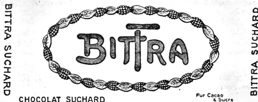
(Inscriptions et dessins en or sur fond bleu.)

Chocolat, cacao, produits préparés avec du chocolat, savoir: articles de confiserie et de pâtisserie et autres produits et boissons alimentaires sous toutes les formes.