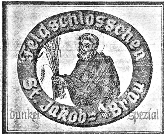
(Die Marke wird braun, gold, gelb, schwarz ausgeführt.)

Nr. 93368. Hinterlegungsdatum: 12. Juni 1938, 4 Uhr. Brauerei Feldschlösschen, Rheinfelden (Schweiz). Fabrik- und Handelsmarke.