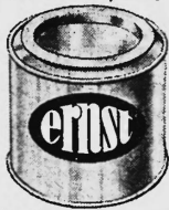
Ernst & Co Blechdosenfabrik Kusnacht (Zürich)

Inserate haben im Schweiz. Handelsamtsblatt hesten Erfolg.