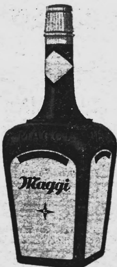
(La marque est exécutée en jaune, rouge et brun.)

Produits alimentaires et condiments, produits diététiques, pharmaceutiques chimiques pour l'industrie et les sciences et produits agricoles.