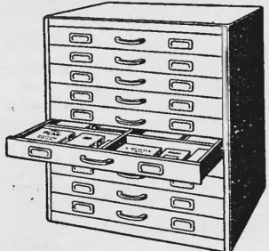
KOMBI-Plan- und Prospekttschrank: 10 Auszüge für Normalformate A1 bis A4, mit oder ohne Zentralverschluss. Höhe 112, Breite 100, Tiefe 74 cm.