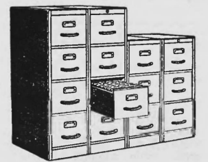
KOMBI-Vertikal-Schränke mit 3 oder 4 Auszügen für Hängeregistraturen A4. Kugellagerführung. Seitenwände demontierbar. Bequeme Holzgriffe und Etikettenrahmen.

Durch normgerechte KOMBI-Möbel zum harmonischen Büro! Jede Neuanschaffung fügt sich in Stil, Form und Proportionen elegant ins Ganze ein.