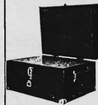
Der Schweizer KLEIN-Folokopterapparat mit der grossen Leistung