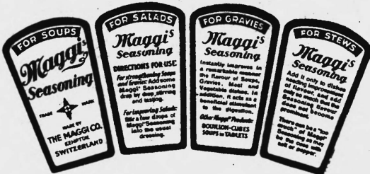
Die Marke wird gelb und rot ausgeführt.

Nr. 114746. Hinterlegungsdatum: 22. März 1946, 18 Uhr. Fabrik von Maggis Nahrungsmitteln, Kempththal (Schweiz). Fabrik- und Handelsmarke.