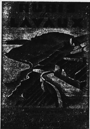
La marque est exécutée en noir, brun et brun-rouge.

Vin rouge de Lavaux du domaine de la Crausaz (Grandvaux).